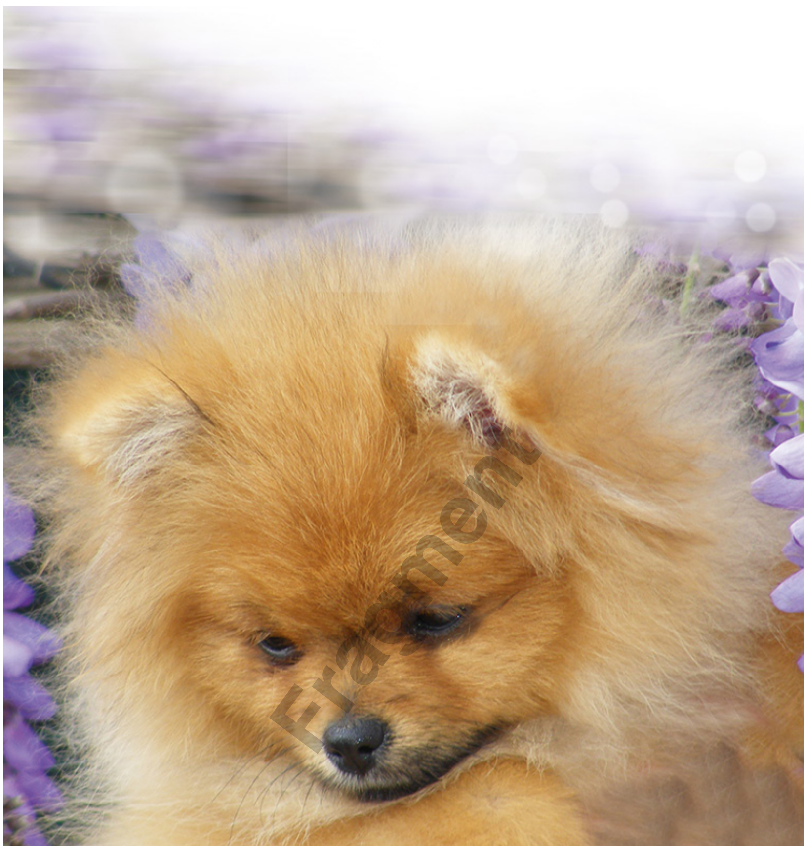
Hillside Rendezvous Marron Glace' - Pomeranian Hodowla Hillside Rendezvous Kennel