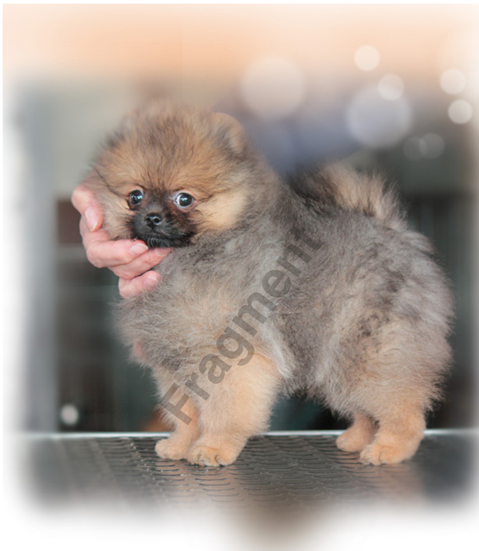
Hodowla Hillside Rendezvous