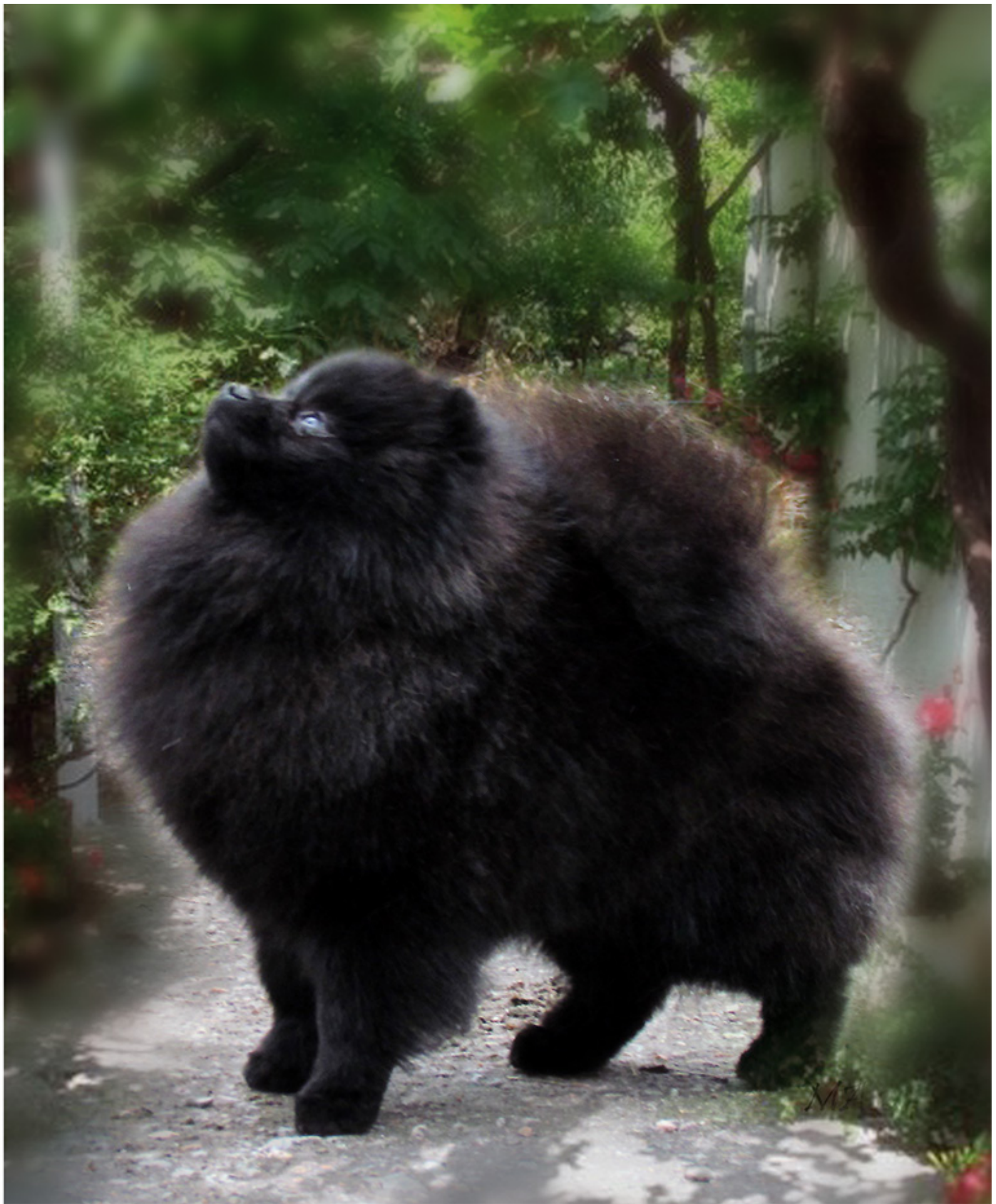
Biconty's Crash Boom Rock - Hodowla Biconty's Finlandia