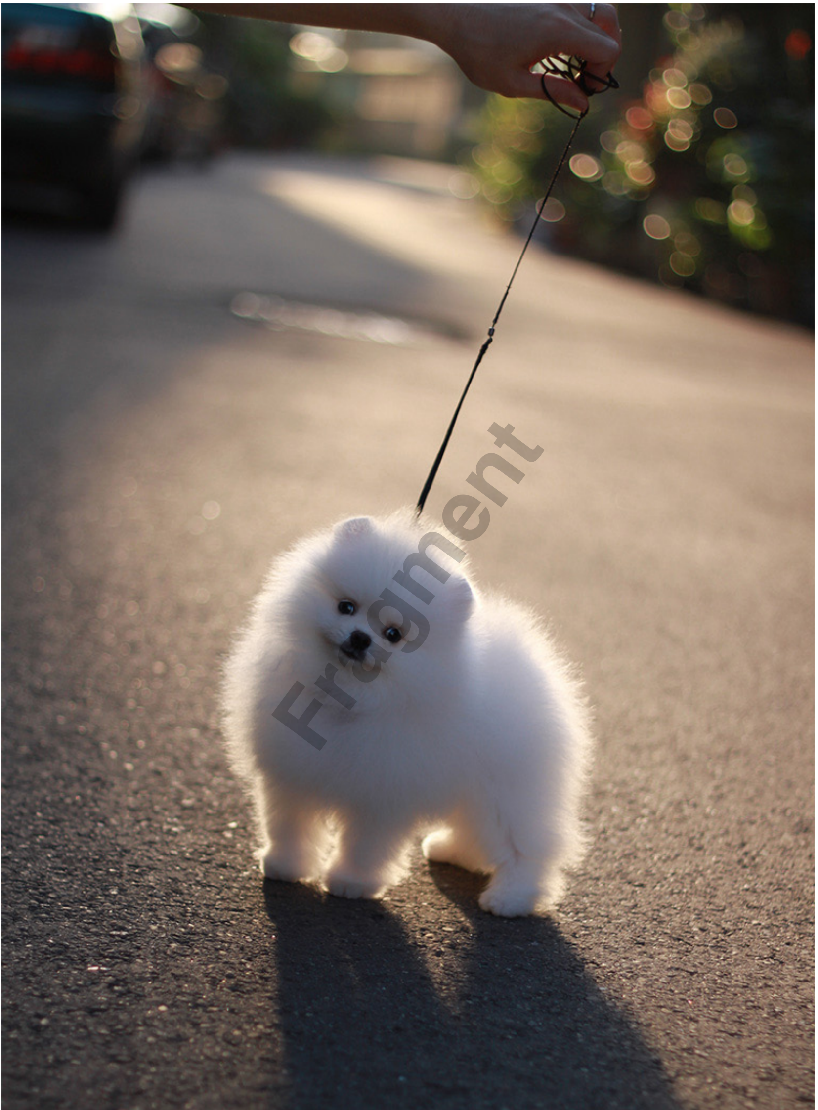
Hodowla Victoria Poms - Camel Lou Hsinchu - Taiwan