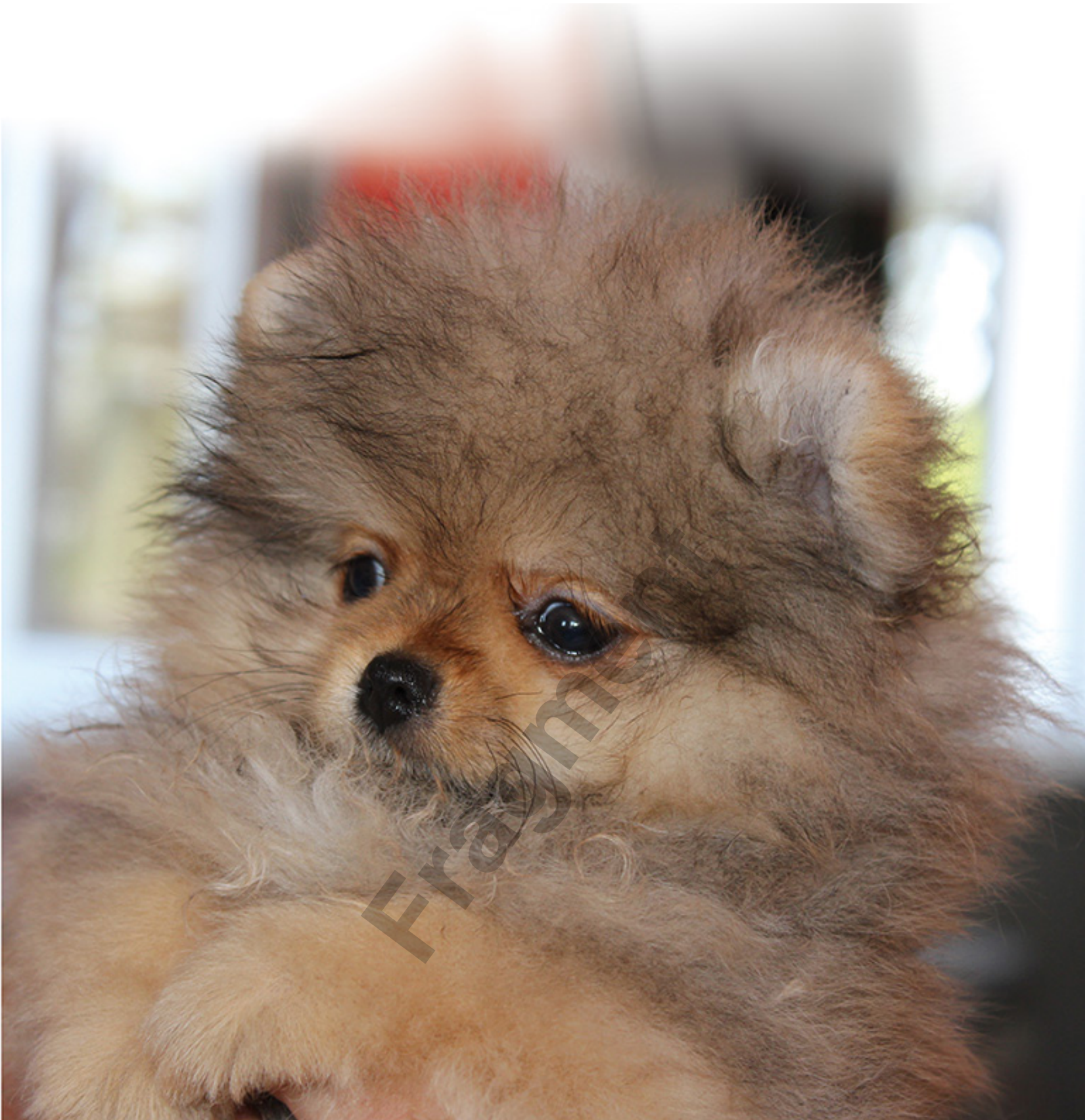
Paparazzi's Obsession - Szczeniak Pomeraonii - Hodowla Hillside Rendezvous