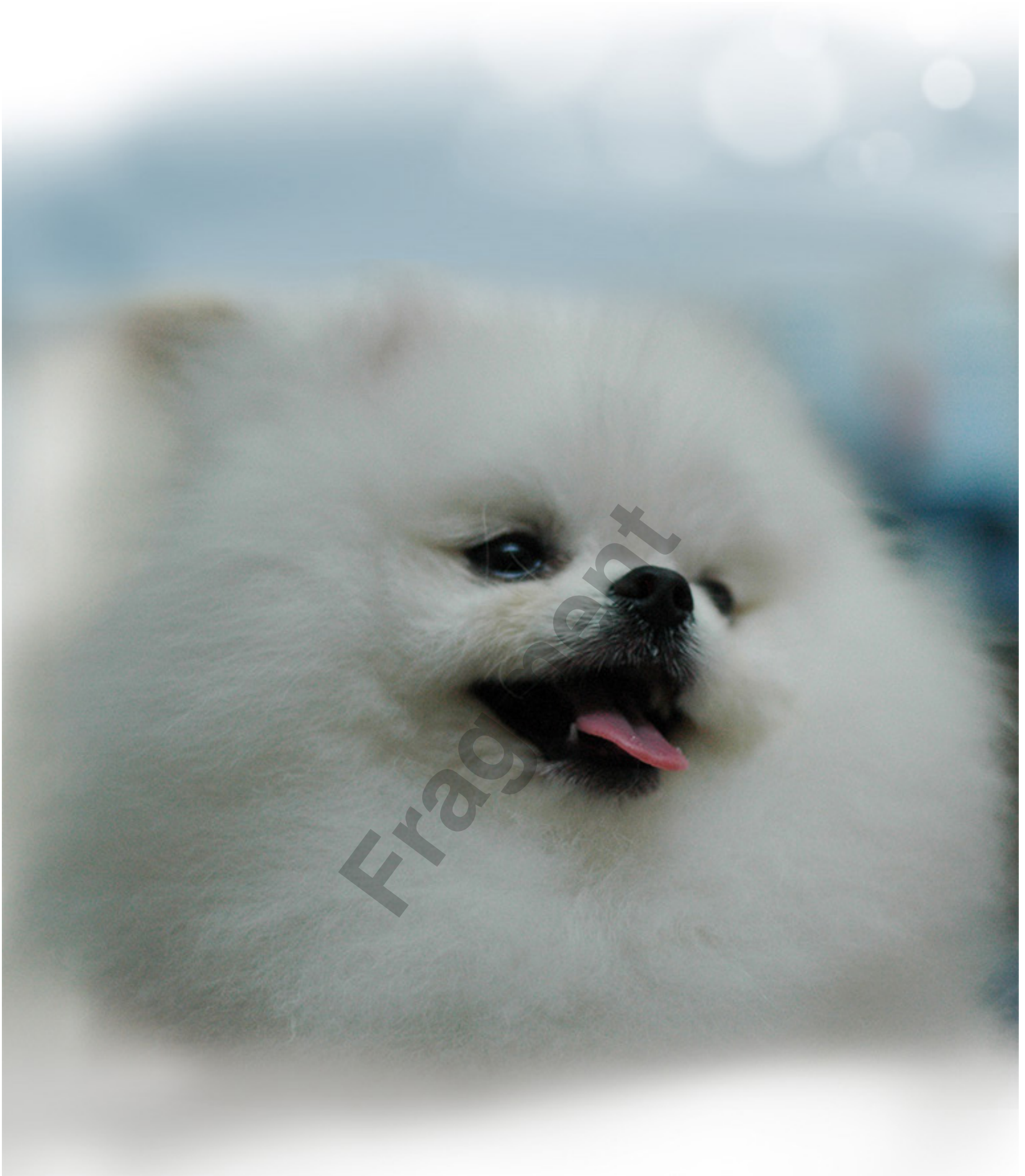
Camel Lou - Hsinchu - Taiwan Hodowla Victoria Poms