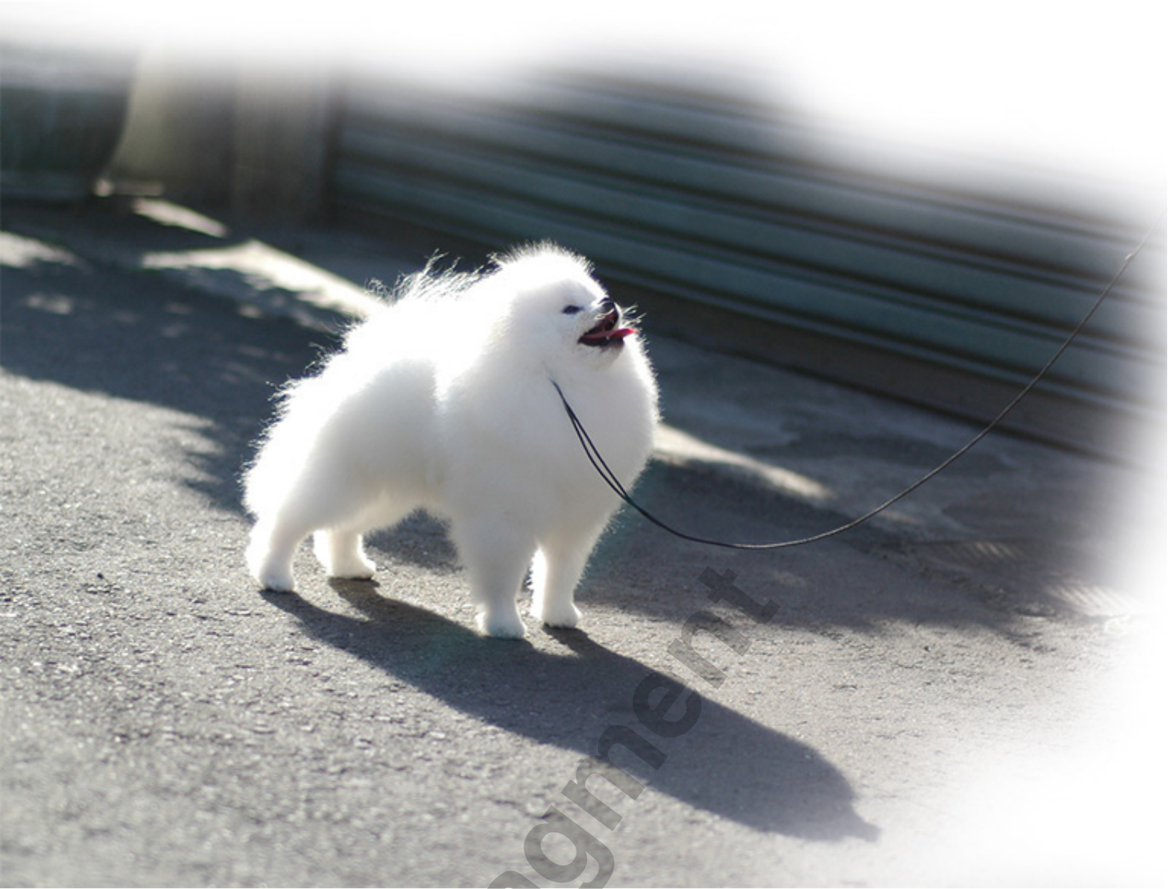
Hodowla Victoria Poms - Camel Lou Hsinchu - Taiwan