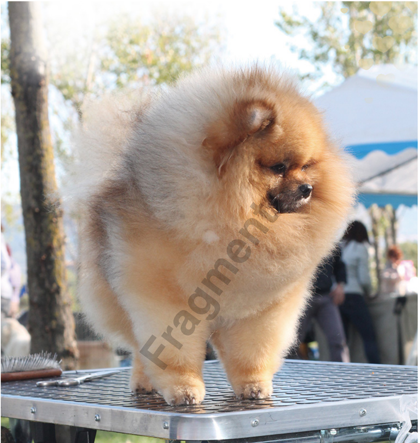
Wielokrotny Champion Międzynarodowy - Hillside Rendezvous Nobody does it better Szpic niemiecki miniaturowy - Hodowla Hillside Rendezvous