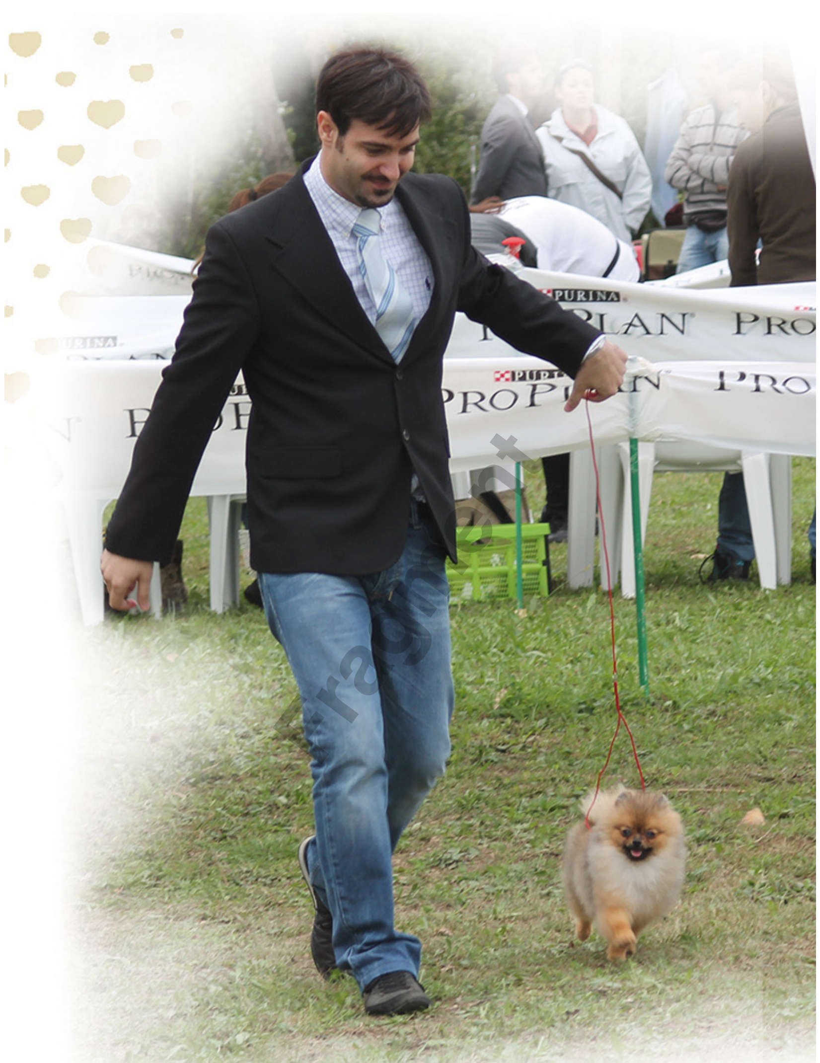
Pierwsze doświadczenia ekspozycyjne w klasie juniorów Hillside Rendezvous In The Sky With Diamonds, Pomeranian