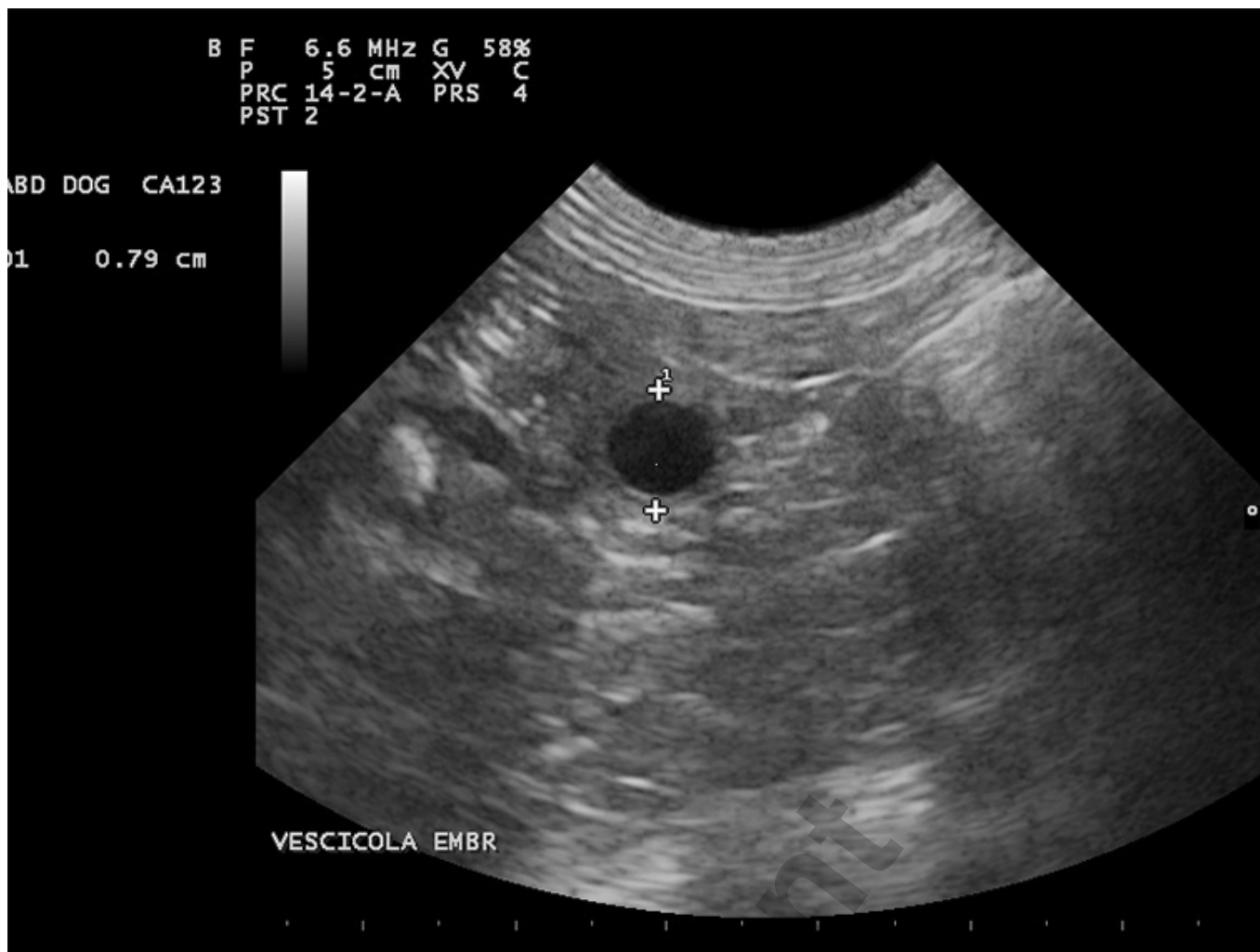
Pęcherz ciążowy około 20 dni