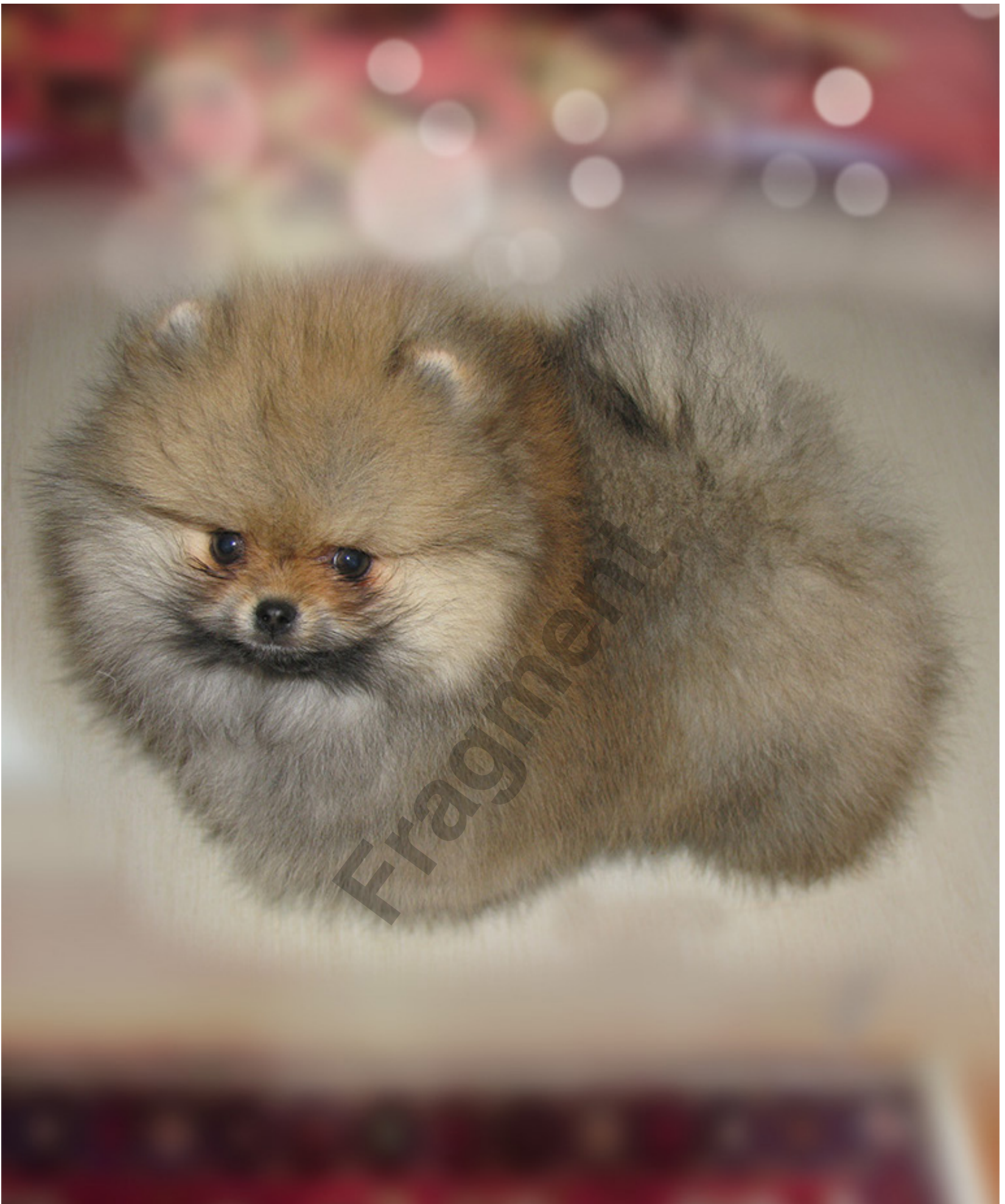
Misterpom Prince - Misterpom Kennel