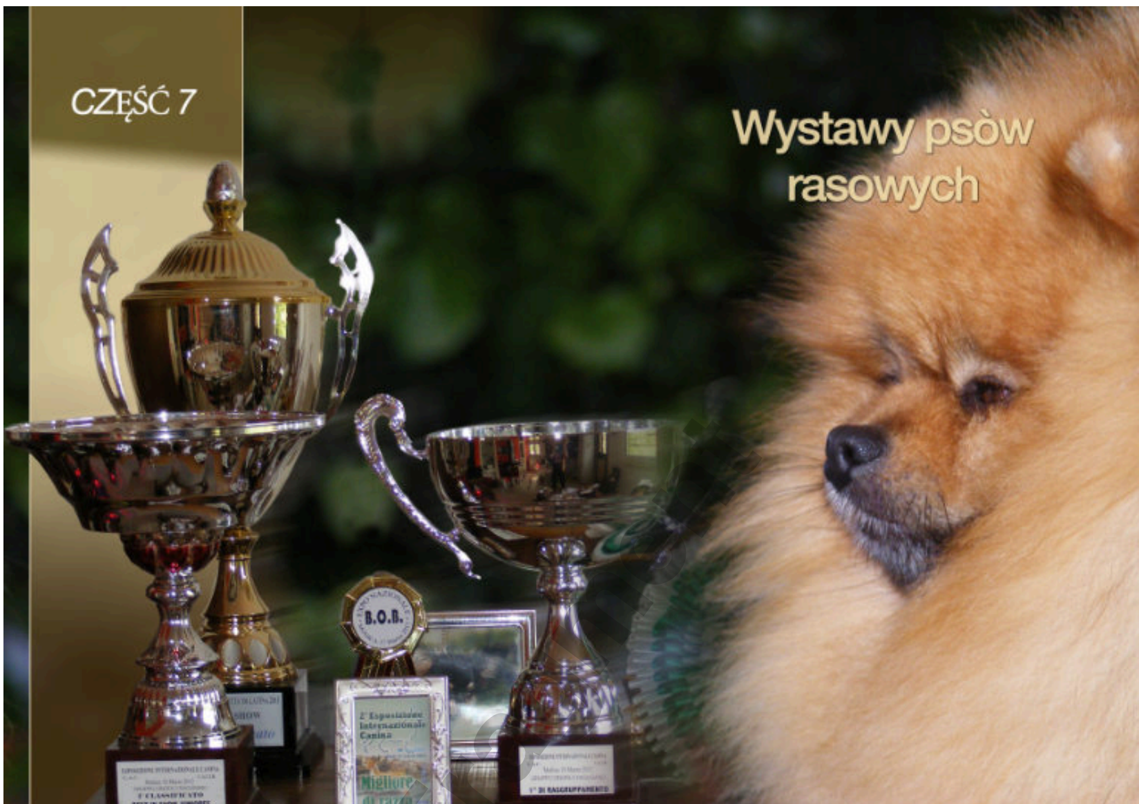
Wielokrotny Międzynarodowy Champion Piękności - Hillside Rendezvous Nobody does it better - Szpic niemiecki miniaturowy - Hodowla Hillside Rendezvous