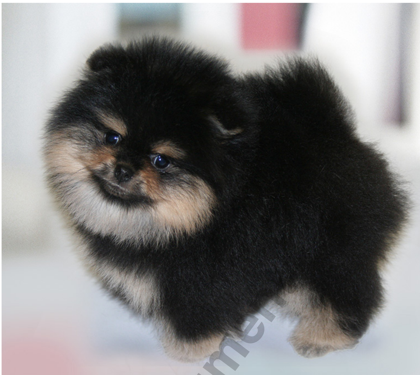
Szczeniak Pomeranii z Hodowli Jan-Shars (West Virginia - USA)