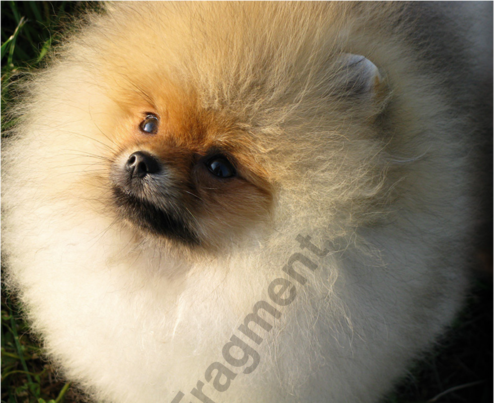
Prince Toretto Fast and Furious - Hodowla Misterpom