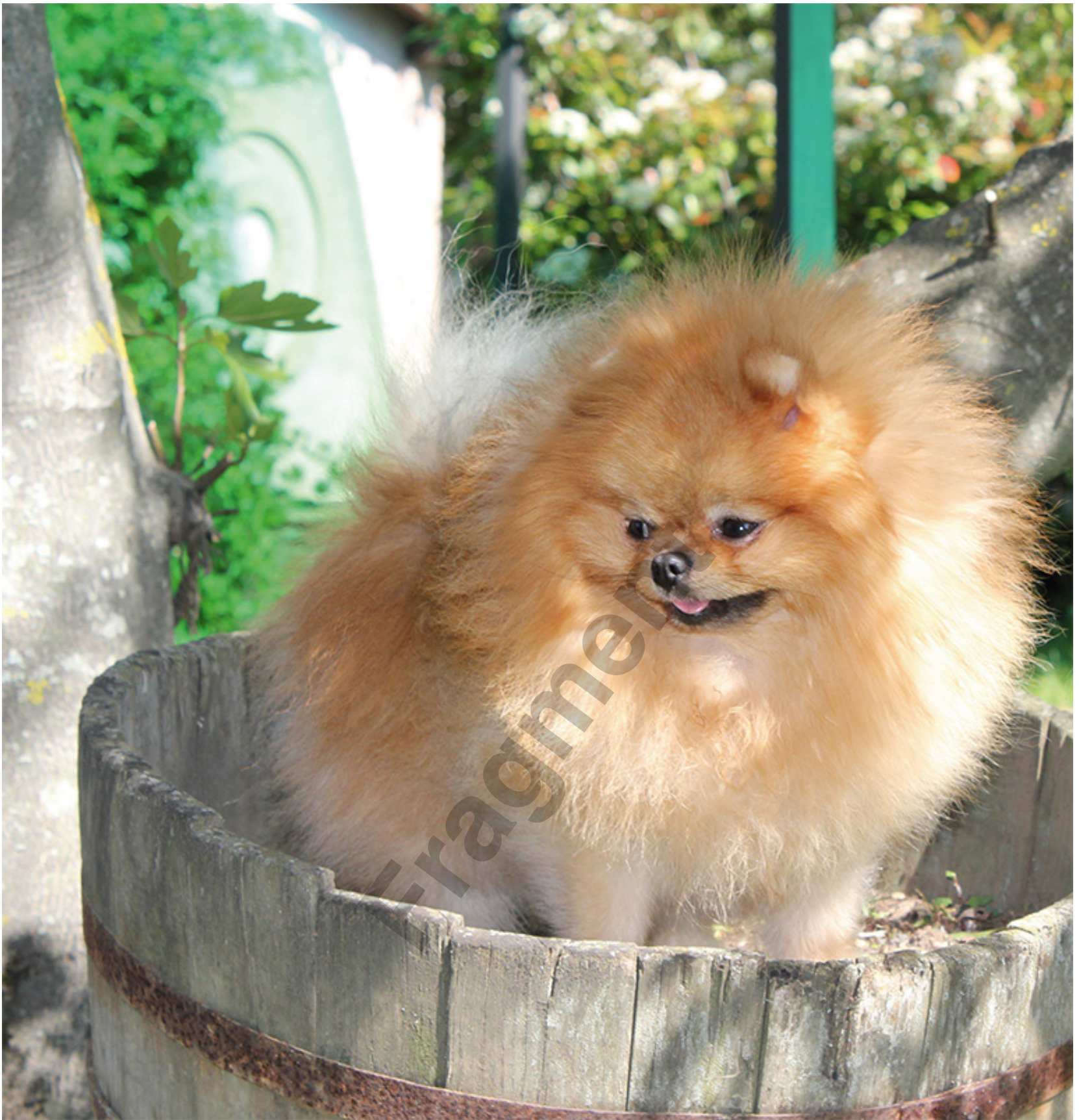
Wielokrotny Champion Międzynarodowy z Hodowli Hillside Rendezvous - Midnight Melodies, Pomeranian.