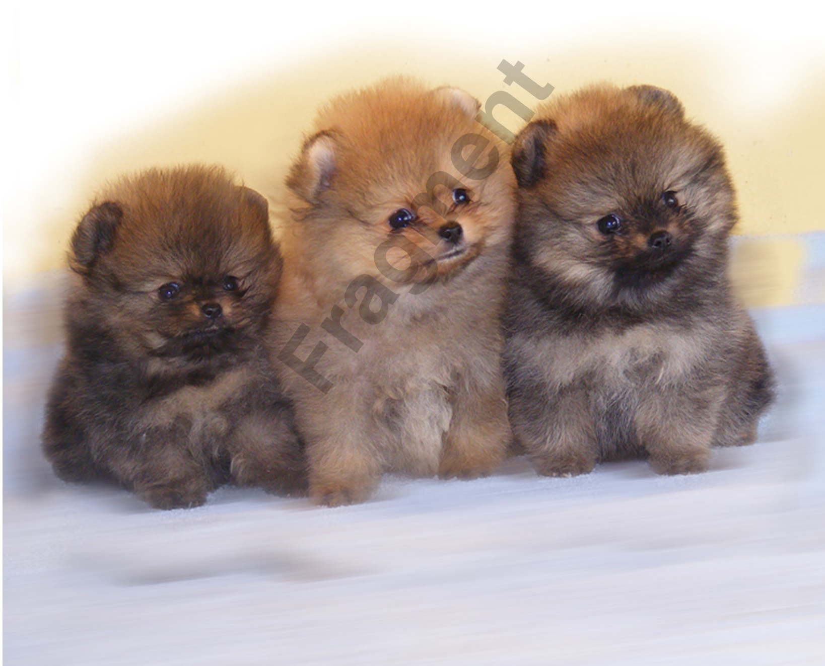
Szczeniaki Pomeranian - Hodowla Hillside Rendezvous Od lewej: Sicily Playboy, The Lion King, In The Sky With Diamonds (Szczeniak wybrany przez Hodowlę Misterpom)

Dobrze więc aby w pierwszej fazie po urodzeniu i do co najmniej 80 dni życia szczeniaki mogły przebywać z innymi psami ze swojej psiej rodziny. [...]