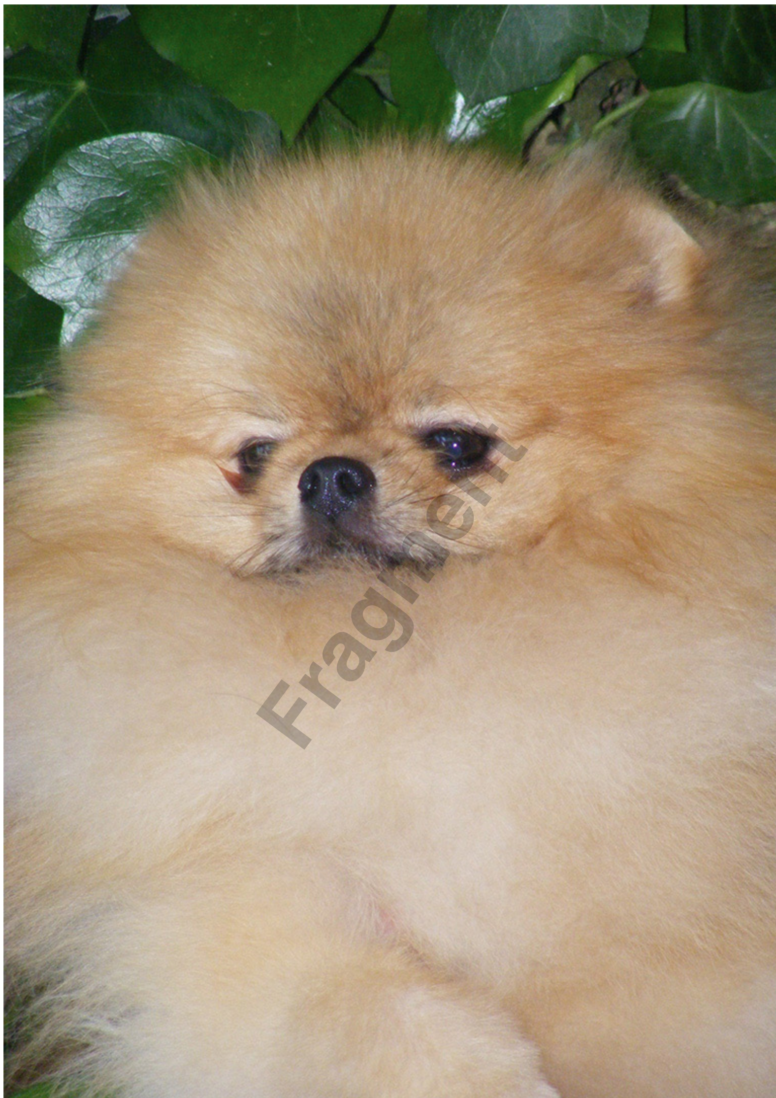
Hillside Rendezvous Mini Cooper - Pomeranian