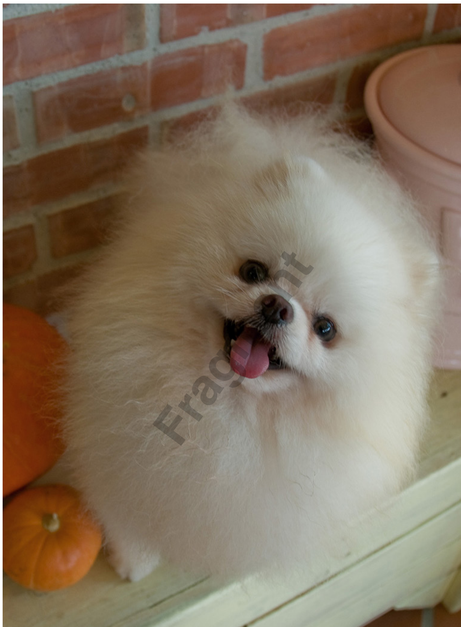
Hodowla Victoria Poms - Camel Lou Hsinchu - Taiwan