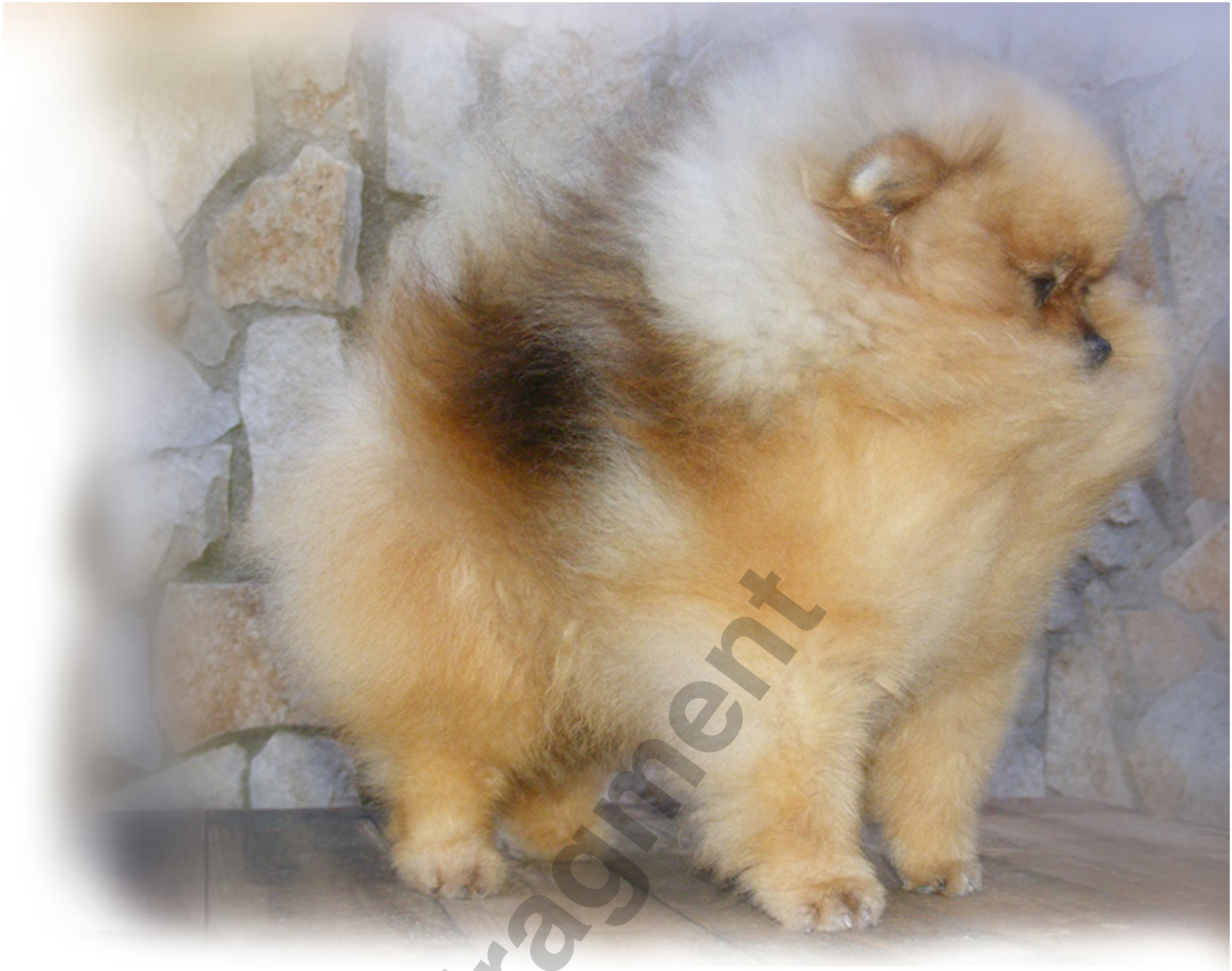
Wielokrotny Champion Hillside Rendezvous Nobody Does It Better - Szpic niemiecki mały - Hodowla Hillside Rendezvous Kennel